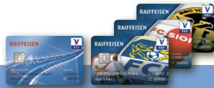
Carte V PAY