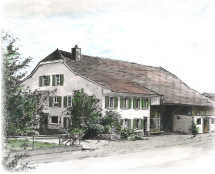
Il était une fois la ferme Pasquier en 2019*...

Vingt mois plus tard, nous sommes heureux de prendre possession de nos nouveaux locaux à 50 mètres de notre agence provisoire actuelle. Le samedi 1 er juin 2024, nous ouvrirons les portes de notre nouvel écrin situé à la Route de Fribourg 60 en compagnie des autres prestataires de services qui s'installeront dans ce bâtiment flambant neuf. Tous, nous nous réjouissons déjà des futurs moments que nous partagerons avec vous dans ce nouvel espace.