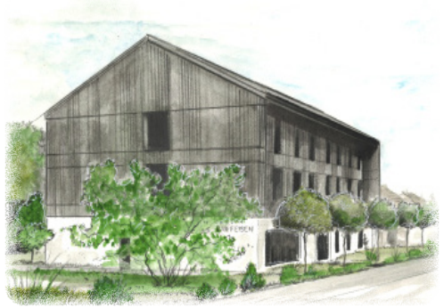
... qui est devenue le nouveau bâtiment de notre Raiff*.

Dans ce bâtiment, nous avons décidé de créer une nouvelle image adaptée à nos valeurs. Les collaborateurs disposeront d'outils de travail et d'un environnement modernes. Quant aux clients, ils auront la possibilité de se retrouver dans un concept novateur où il leur sera proposé l'intégralité des prestations bancaires.